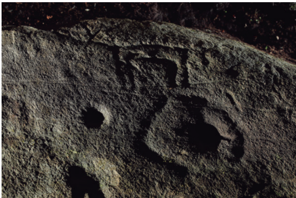
Foto 3.- Representación animal do panel Chousa Vella-Monduriz 2.