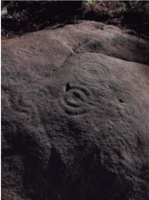
Foto 1.- Parte central do panel Súa Lomba-6.