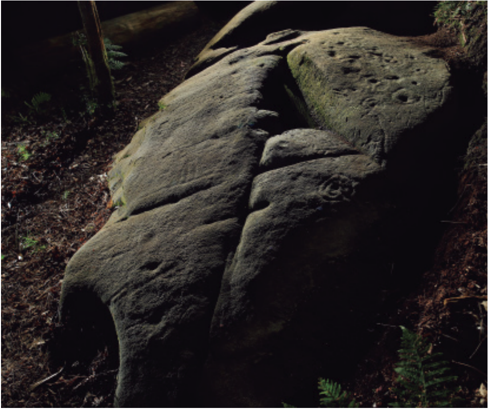
Foto 6.- Vista xeral do panel Chousa Vella-Monduriz 2. Na parte superior as figuras xeométricas e unha figura animal e na parte inferior, zona inclinada as armas.

Nesta parroquia, ata hoxe, foron documentados trinta e un paneis con gravados (GATT 1999, 2003, 2008, 2009, 2011) nos grupos: Cainzo (2), Pena da Zoca (2), Chousa Vella (6), O Castro (2), Bordello (4), Monte Grande (os paneis 6, 7 e 8) e outros paneis soltos en Chousa do Tras, Fontevella/Belsar, O Pleito, Lamelas, Chousa do Penedo, Tras a Laxe, Rego de Pazos, Maceira, Tras da Igrexa, Roza Nova, Coto da Fraga e Coto do Abeledo. Non incluímos nesta parroquia os conxuntos de Revolto, Calvela, Chousa do Montañés, parte do Monte Grande (números 2 o 6) e Monte Grande-A Chaeira que erroneamente foron situados nas publicacións anteriores nesta parroquia e que se atopan na de Vilamateo (fig. 3).