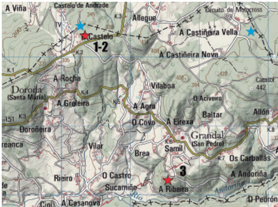
Fig.1.- Plano de situación das parroquias de Doroiña e Grandal. As estrelas azuis son os paneis con gravados xa publicados en anos anteriores, as vermellas as dos paneis novos.

Lambre e Baxoi e que permiten a división do terreo en pequenos vales. As maiores alturas do concello atopámolas ó N no monte do Catasol (444 m) e ó NE do monte Grande (374 m).