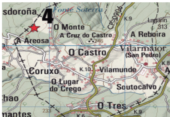
Fig. 2.- Situación do panel de Agra do Conde, San Pedro de Vilarmaior.

3) Penedo do Xunco (Coordenadas UTM 571546 – 4802208, cota de altitude 198 m). Pequeno afloramento situado a carón da entrada dunha finca moi pendente, cara ó S (fig. 1). Ten unhas dimensións de 2,25 m N-S x 2,40 m de L-O, cunha altura que oscila entre os 1,40 m polo L a 0,80 polo SL. Nel podemos ollar unha combinación circular de 26 cm de Ø, con cazoleta central e dous semicírculos, o segundo incompleto. Un círculo de 22 x 16 cm interrompido por unha diáclase e dúas cazoletas de 9 e 6 cm de Ø respectivamente.