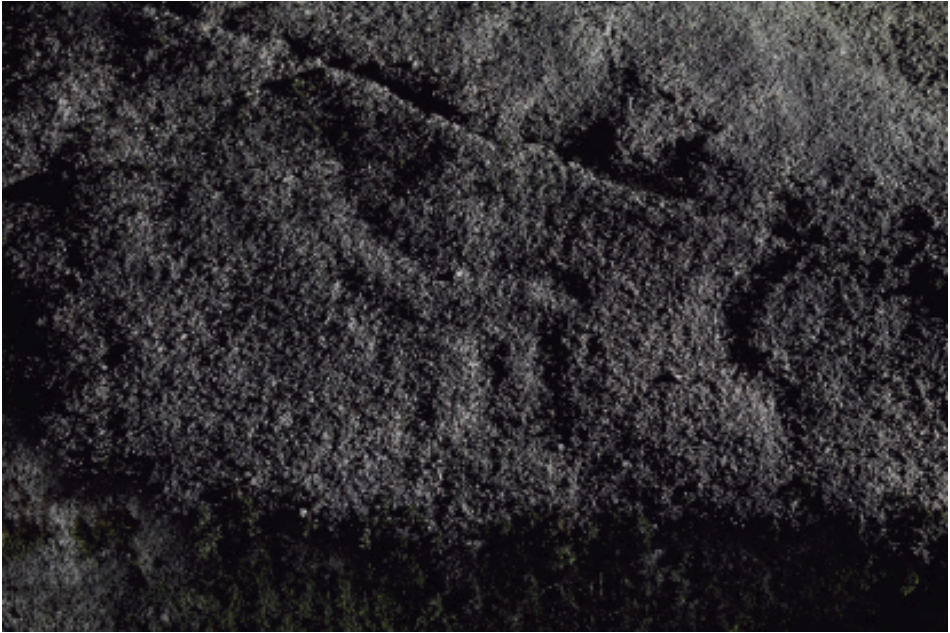
Foto 7.- Representación animal do panel Calvela 2.

17) Revolto-8 (Coordenadas UTM 570698-4798771, cota de altitude 251 m). Situado inmediatamente ó N do panel de Revolto-3 (GATT 2008). Afloramento a ras de chan cunhas dimensións de 5,60 m N-S x 4 L-O, está dividido de N a S por unha pequena veta de seixo. No L do afloramento hai varias pías naturais, e nos pequenos curutos que forma a pedra ollamos tres cazoletas de 4 e 4,5 cm de Ø e un pequeno círculo de 15 cm de Ø con cazoleta central. Na parte O da veta encóntranse a maioría dos gravados, tres cazoletas simples de 5 e 7 cm Ø, dúas cazoletas de 4 cm unidas por unha raia e unha cazoleta con dous sucos de saída de 24 cm de longo, en forma de V. Tamén podemos ollar unha combinación de círculos concéntricos de tres aros e un cuarto incompleto, de 30 cm de Ø, con suco de saída; outra combinación de círculos concéntricos de 40 cm de Ø, de dous aros con cazoleta central e tres raias que forman un apéndice rectangular do que parte o segundo aro; un pequeno círculo de 12 cm con cazoleta central e os restos dunha combinación circular de 24 cm de Ø de dous aros.