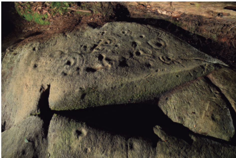
Foto 2.- Conxunto de figuras xeométricas na parte superior do panel Chousa Vella-Monduriz 2. Na parte superior, marxe esquerda está a figura do animal.