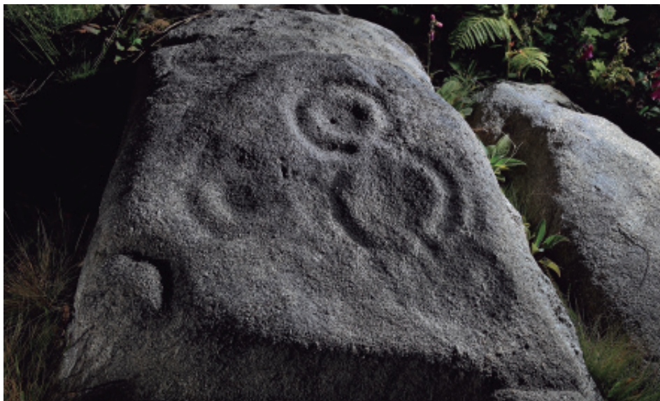
Foto 10.- Combinacións circulares da terceira pedra do panel Calvela de Abaixo 6.

parroquia está formada por xeoesquistos e a veta granítica tan só ocupa a metade oriental, que é onde localizamos os gravados (fig. 3).