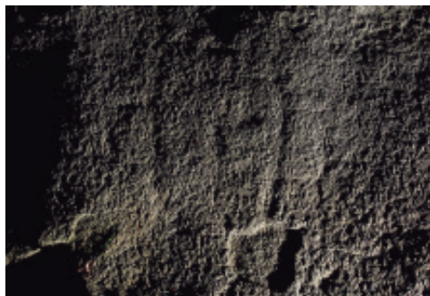
Foto 4.- Posible escutiforme do panel Chousa Vella-Monduriz 2.