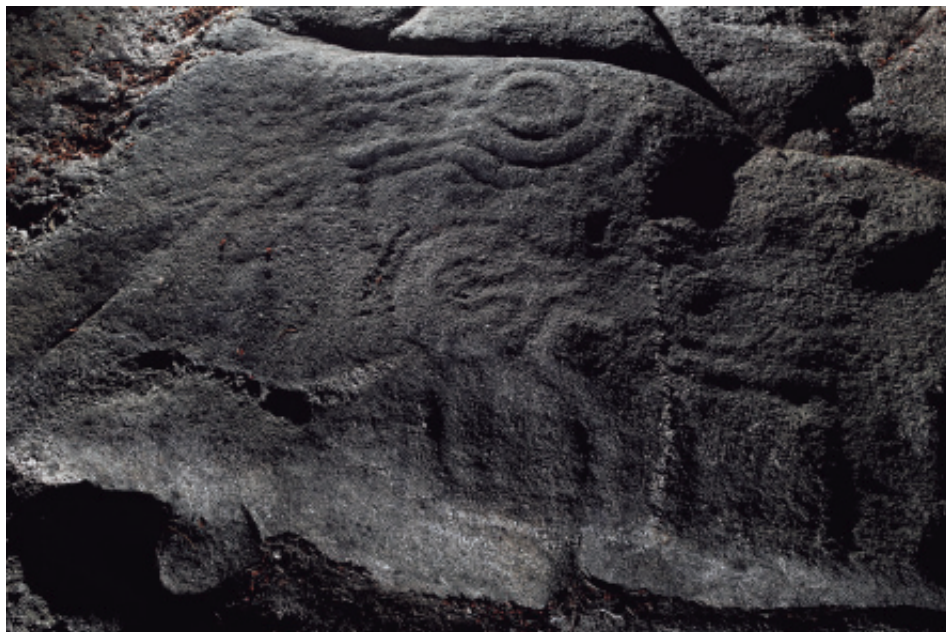
Foto 8.- Combinacións de círculos concéntricos do panel Calvela de Abaixo 4.

que é por onde cae fundamentalmente. En principio pasou desapercibido, posto que polo único motivo que foi inventariado é por unha cruz de 16,5 cm de alto x 23 de ancho, que se amosa na parte máis inclinada do panel, pero na parte superior tamén se pode ollar un semicírculo de 26 cm de \emptyset e unha cazoleta de 4,5 cm de \emptyset .