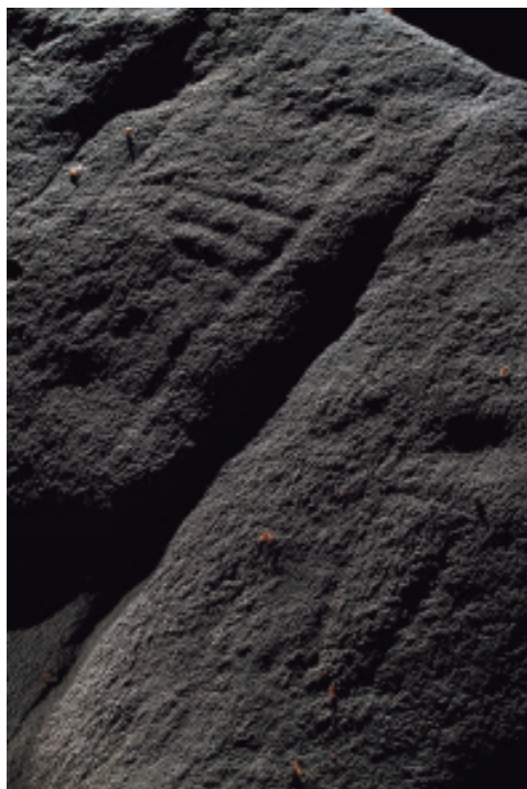
Foto 5.- Armas do panel Chousa Vella-Monduriz 2.

Na parte inclinada desta zona do afloramento, ó O, ollamos unha rara combinación de tres triángulos paralelos de 28 x 30 cm, con dous sucos de saída que rematarían nunha combinación circular, á súa vez asociada a outras combinacións circulares rotas pola parte inferior. Cara ó L, unha representación, con moitas reservas, do que puidera ser un escutiforme, máis cadrado do que soe ser o habitual nas representacións rupestres galegas, e que máis parece unha cara, semellante a unha máscara funeraria. Esta figura está rota na parte inferior por un esconche da pedra (foto 4). Continuando polo lateral cara ó L, unha clara representación dunha alabarda, cunha vara de 50 cm de longo, que parece rematar na parte superior nunha cazoleta. Inmediatamente despois dunha greta, a representación dunha posible espada ou puñal (foto 5). Nesta zona da pedra hai outras sete cazoletas de entre 7 e 4 cm de Ø, e moitas raias, todas elas máis esvaecidas. Por estas representacións, este panel convértese nunha excepción no NL de Galicia ó aglutinar non só diferentes figuras xeométricas senón tamén unha representación dun animal e armas (foto 6).