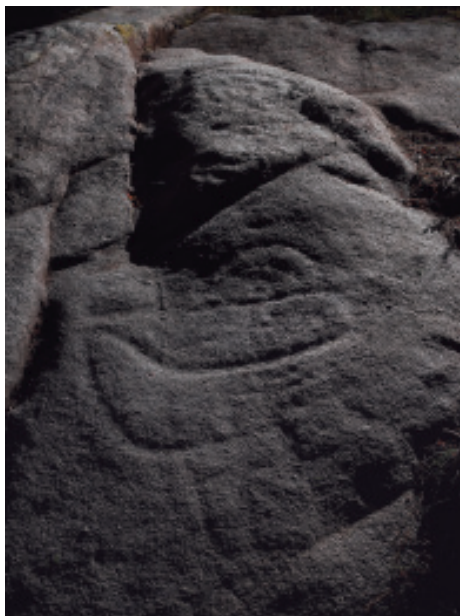
Foto 9.- Novos gravados no panel Monte-Grande 3.

26) As Lamas-1 (Coordenadas UTM 572258-4798999, cota de altitude 289 m). Afloramento xunto a un valo e pedras, que forma un socialco polo S onde ten unha altura de 90 cm. As dimensións son de 5 m N-S x 5,50 L-O. Nel están representadas unha cazoleta ovalada de 5 x 7 cm, catro pequenos círculos simples de entre 11 a 18 cm de Ø que rodean unha pía