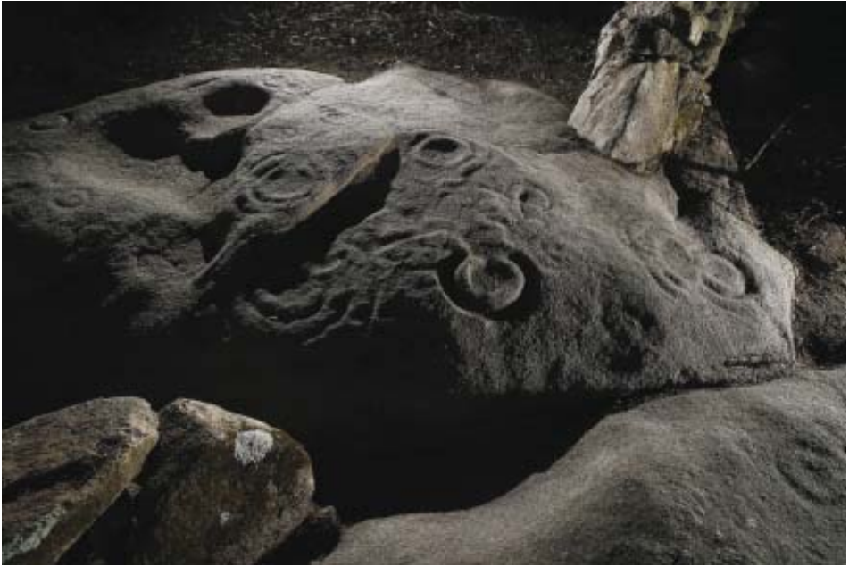
Fotos 2 e 3.- Conxunto de combinacións circulares ao oeste do panel Edreiros-1 (Vilachá).