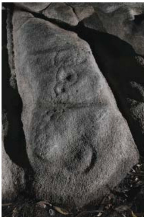
Fotos 4 e 5.- Parte alta e parte baixa do panel Edreiros-2 (Vilachá).