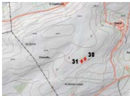
Mapa 5.- Situación dos gravados de Caldoval (San Fiz de Monfero).

únicos afloramentos graníticos con gravados que atopamos na parroquia de San Fiz. Este primeiro está a ras do chan, e ten 1,30 N-S x 2,30 m L-O. No L podemos ollar dúas cazoletas e unha raia con forma de cuñeira; ao O once cazoletas e unha pequena cruz.