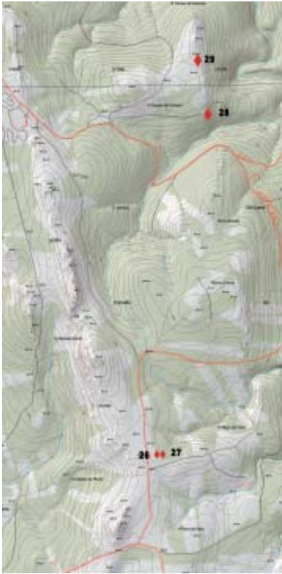
Mapa 4.- Situación dos gravados de Lombo de Egua-Pena Carqueixa e Pena Cruzada de sobre Cortizas (San Fiz de Monfero).

base do afloramento unha pía de 85 N-S x 52 cm L-O, que posiblemente sexa artificial.