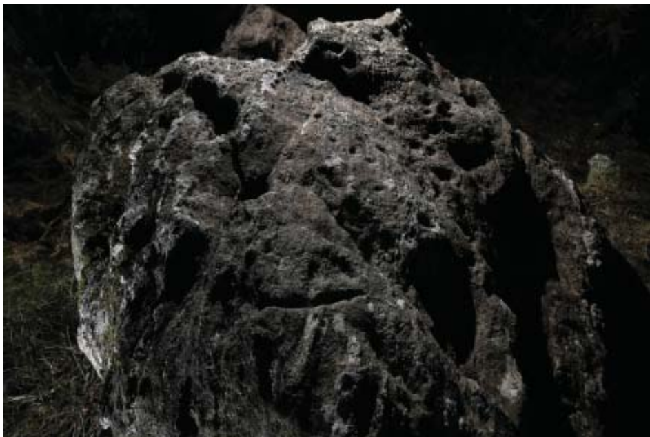
Foto 12.- Vista xeral dos gravados de Pena Cruzada de sobre Cortizas (San Fiz de Monfero).