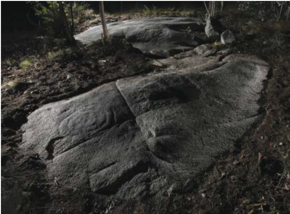
Foto 7.- Vista xeral dos gravados do panel O Pico (Vilachá). En primeiro plano, espiral destróxima.