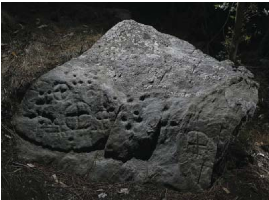
Foto 11.- Conxunto de gravados do panel Pena Bicuda-2 (San Fiz de Monfero).