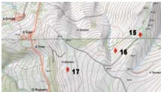
Mapa 2.- Situación dos gravados do monte de San Bartolo (San Fiz de Monfero).

16) Marco do Monte de San Bartolo (coordenadas 578892 - 4805128, xeográficas 8° 01' 32,23" - 43° 23' 38,75", cota de altitude 488 m). Trátase dunha pedra exenta, probablemente un marco, que foi tumbado. Ten unhas dimensións de 1,75 N-S x 0,78 m L-O. Actualmente