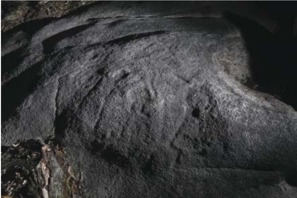
Foto 6.- Conxunto de gravados do panel O Pico (Vilachá). En primeiro plano, posibles figuras antropomorfas.