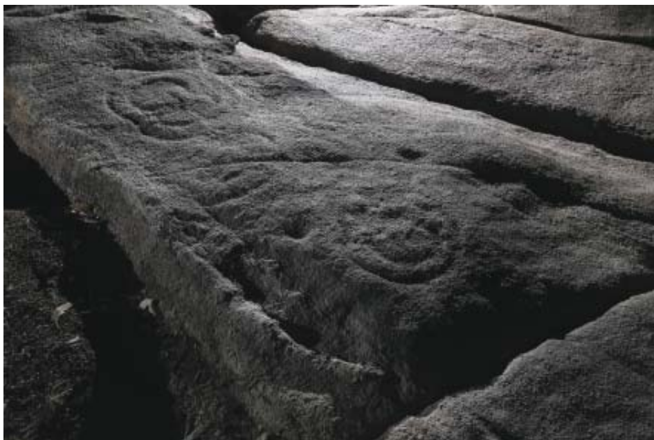
Foto 8.- Combinacións circulares do panel Chousa de Abercovo (Vilachá).

7) Edreiros-4 (coordenadas UTM 572130 - 4801427, xeográficas 8^{\circ} 06' 36,52'' - 43^{\circ} 21' 41,25'' , cota de altitude 301 m). Pequeno afloramento a ras do chan, que xunto a Edreiros-5 están intercalados xeograficamente entre os paneis de Edreiros 1 e 2. Ten unhas dimensións de 1,25 x 1,00 m. No extremo O encontramos unha cruz de 25 x 18 cm, que remata nun semicírculo. A cruz é moi similar á atopada na zona superior do panel Edreiros-2.