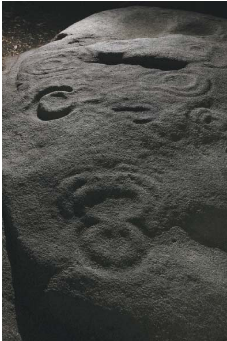
Foto 1.- Posible figura antropomorfa do panel Edreiros-1 (Vilachá).