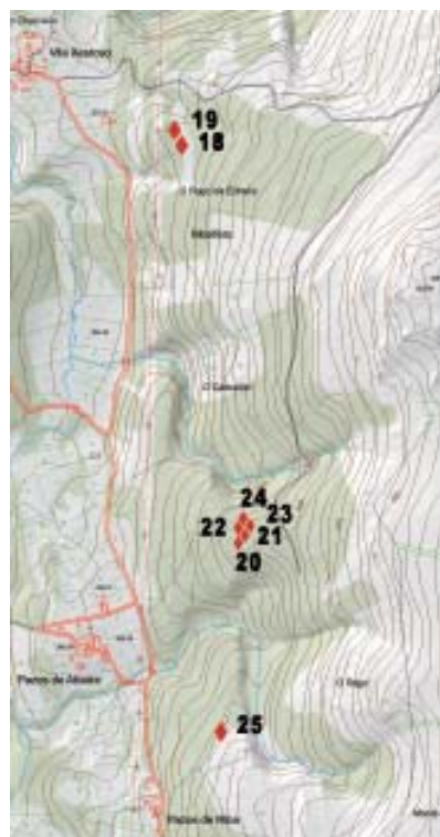
Mapa 3.- Situación dos gravados da Pena das Ebés - Pena Bicuda e Cabuchiña (San Fiz de Monfero).

23) Pena Bicuda-4 (coordenadas UTM 578504 - 4801244, xeográficas 8^{\circ}01'52,48'' – 43^{\circ}21'33,02'' , cota de altitude 442 m). Pena en vertical, que ao igual que a anterior forma parte dun valo. Ten unhas dimensións de 1,90 de alto x 2 m de ancho, na parte superior do lado N, hai unha pequena cruz de 11 x 9 cm.