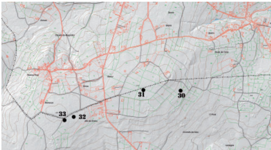
Fig 6.- Plano de situación dos túmulos do linde dos concellos de Mugardos e Ares.

En canto á altitude, os datos que nos aporta esta análise non son fiables, xa que a maioría (70% - 23 túmulos) se encontran nas cotas de 320 a 355 m, pero estes túmulos correspóndense integramente coa zona do Monte Marraxón. O resto dos túmulos en zonas altas son: tres deles (9%) nas cotas de 186 e 228 m; un na cota de 114 e un túmulo na cota dos 421 m, que se corresponden coa Pena Louseira, no linde dos concellos de Neda e San Sadurniño. Destacan polo inusual os localizados en zonas baixas (5 túmulos – 15%, nas cotas entre 66 a 85 m, que tamén corresponden a unha zona concreta: os concellos de Mugardos e Ares). Con total seguridade esta proporción sería maior si se tiveran conservados os túmulos de chaira, pero estas soen ser zonas moi traballadas pola man do home.