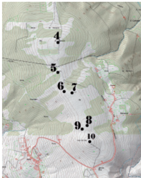
Fig. 3.- Plano de situación dos túmulos de Marraxón nos concellos de Neda e Fene.

10) Coto do Rei (coordenadas UTM 570306 – 4814534, xeográficas 08° 07'50,47" – 43° 28'46,68"). Emp.: Cume. Alt.: 355 m. Reg.: 450 m. Subst.: Granito de dúas micas moi deformado. Terr.: Monte baixo. Med: 19 m de Ø e unha altura que oscila entre os 1,10 polo O ata os 0,80 polo L; burato de violación 6 m N-S x 6,50 L-O x 0,70 de profundidade. Est.: Regular, debido á forte violación e ás constantes agresións que sofre. Cabe salientarse que é un túmulo que se pode visualizar dende máis de 15 km. de distancia. Está situado nun