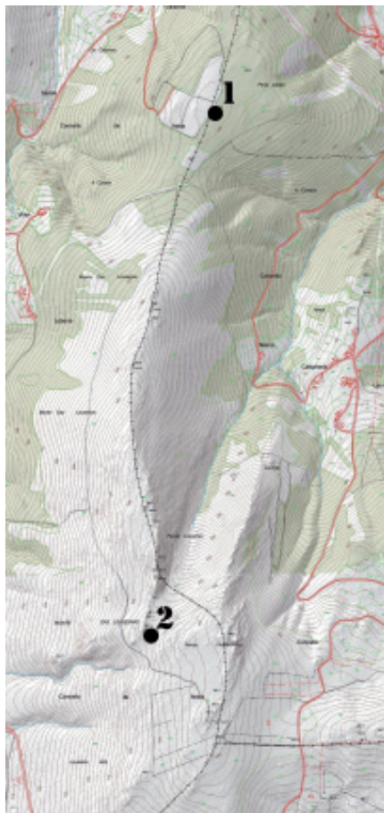
Fig. 1.- Plano de situación dos túmulos de Cortella e Louseira (Neda)..

Postos a aclarar despropósitos sobre este túmulo, dicir que non é un dolmen, nin está no lugar de Chao de Aldea (Viladonelle), como poñen a maioría de artigos e noticias publicadas en internet.