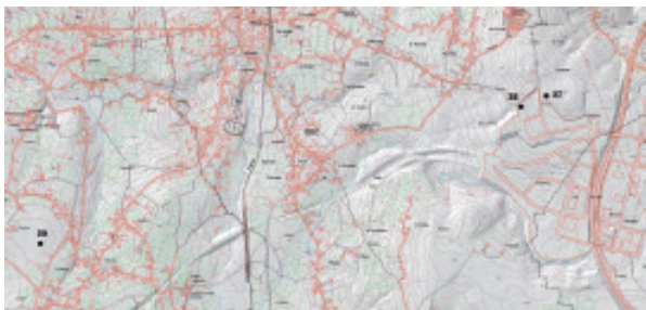
Fig 5.- Plano de situación dos túmulos de Vilar do Colo (Fene) e Monte do Pazo (Mugardos).