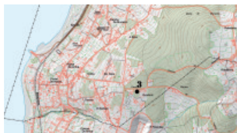
Fig. 2.- Plano de situación do túmulo de Gunturiz (Neda).

3) Mámoa de Gunturiz (coordenadas UTM 568242 – 4815310, xeográficas 08° 09'21,99" – 43° 29' 12,52"). Emp.: Ladeira. Alt.: 114 m. Reg.: 400 m. Subst.: Granito de dúas micas moi deformado. Terr.: Monte baixo. Med: 11 m de Ø x 0,40 de alto; burato de violación 3 m de Ø x 0,20 de profundidade. Est.: Regular, e en perigo xa que está situada nunha zona urbanizable. Na actualidade entre dúas casas. (fig.2)