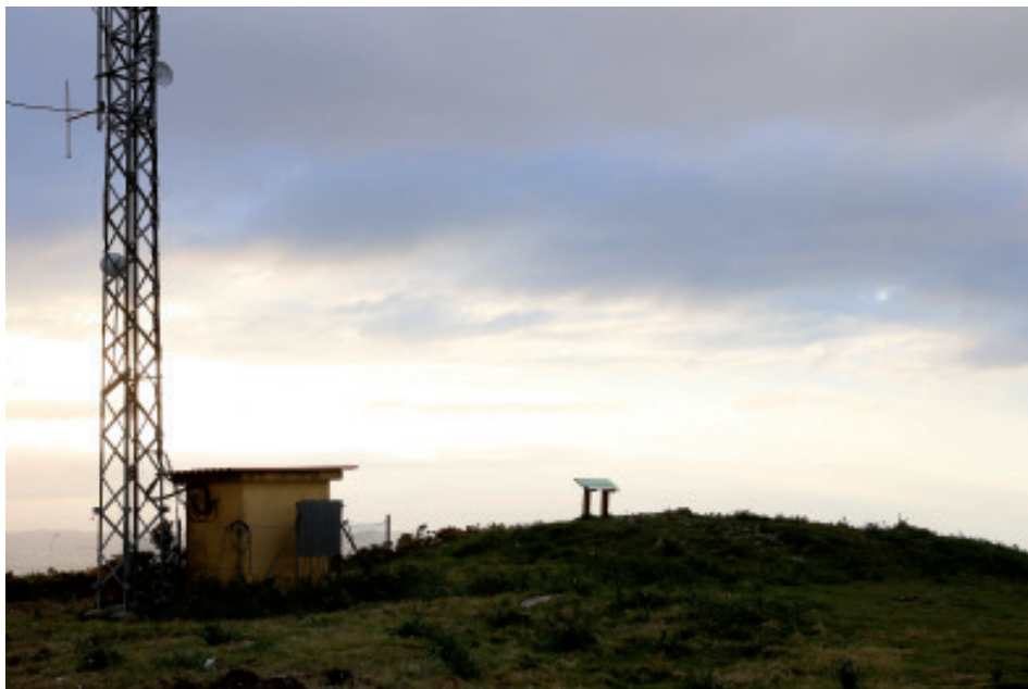
Foto 2.- Mámoa do Coto do Rei (Fene) na que se poden apreciar as diferentes agresións sufridas ó longo do tempo.