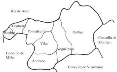
Fig. 2.- División parroquial do concello de Pontedeume.

O concello de Pontedeume, ten unha superficie de 29'5 km 2 , localízase na marxe S da desembocadura do río Eume e está dividido en sete parroquias: de O-L, Santiago de Boebre, Santa María de Centroña, Santiago de Pontedeume, San Pedro de Vilar, San Martiño de Andrade, San Cosme de Nogueirosa e Santa María de Ombre (fig. 2). Administrativamente linda ó N co concello de Cabanas, ó L co de Monfero e ó S cos de Vilarmaior e Miño.