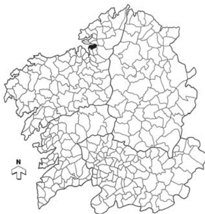
Fig. 1.- Situación do concello de Pontedeume.

A primeira referencia bibliográfica é de 1997 e nela Alberto González e Susana Ricart 1 citan as tres mámoas, aínda que os autores recoñecen que a tupida vexetación impediulles a súa localización. A segunda referencia, feita polo LAFC 2 en 2001, deixa constancia dunha