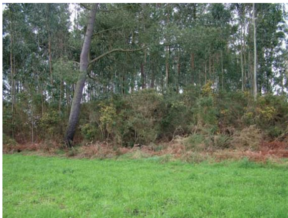
Foto. 1.- Estado actual do túmulo Pena Grande 1.

5) Pena Grande-2 (coordenadas UTM 571576'89 - 4805885'74, xeográficas 8° 06'57''99 - 43° 24'05''95). Emp.: ladeira. Alt.: 387 m. Reg.: 325 m. Subst.: granito de dúas micas moi deformado. Terr.: arborado de repoboación. Med.: 12 de Ø x 0'30 m de alto. Est.: moi malo, está practicamente arrasado, óllanse restos da coiraza e a cabeza dun esteo de granito que sobresae 0'30 de alto x 0'70 m de ancho.