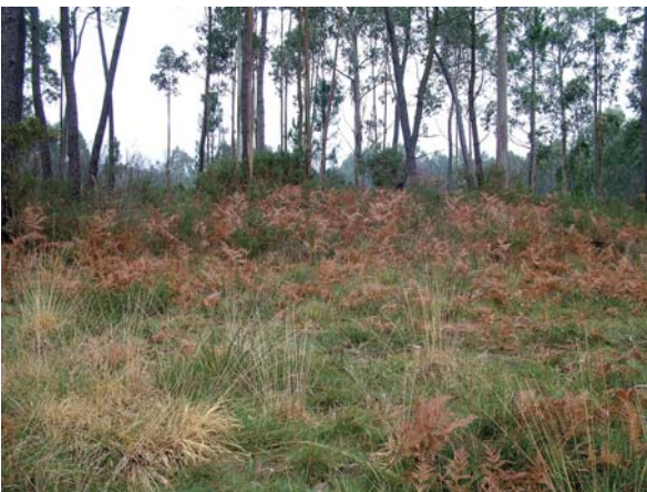
Foto. 2.- Estado actual da Medoña do Turreiro (Campo da Carreira 1).

No resto das parroquias existen tamén varias referencias toponímicas. Así en Boebre encontrámonos con Cista e Arcosa; en Centroña con Mamea, Montiños, Montillos; en Nogueirosa con Arcosa; e en Vilar con Medeño, Medoña e Tesouro;